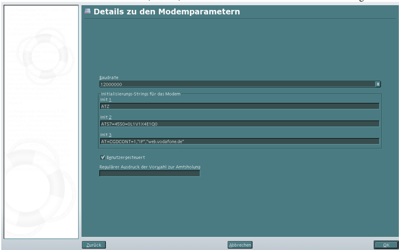
Abbildung 2: Setzen der Modemparameter

Unter Details finden sich die Modem-AT-Parameter, die einzustellen sind: ATZ setzt das Modem zurück, AT&S7=4&S0=0L1V1X4E1Q0 setzt spezielle Modemparameter und mit dem neuen UMTS-Parameter AT+CGDCONT=1, "IP", "web.vodafone.de" wird der Provider gesetzt.